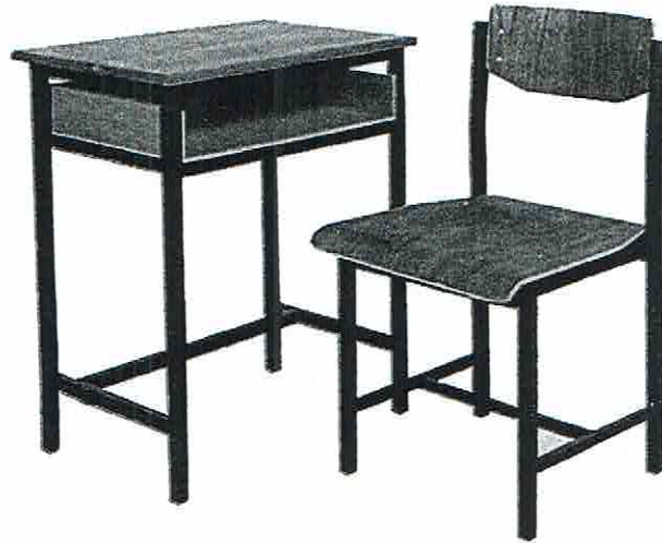
โต๊ะพร้อมเก้าอี้นักเรียน ระดับมัธยมศึกษา