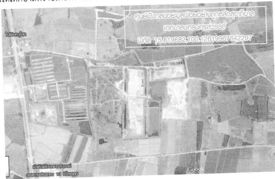
ภาพแสดงภาพถ่ายดาวเทียมบริเวณบ่อฝังกลบเทศบาลนครนครสวรรค์

ที่ตั้งโครงการตั้งอยู่บริเวณพื้นที่ ต.บ้านมะเกลือ อ.เมือง จ.นครสวรรค์ หรือเอกชนจะทำนอกพื้นที่ให้ แจ้งให้เทศบาลทราบเพื่อพิจารณาด้วย