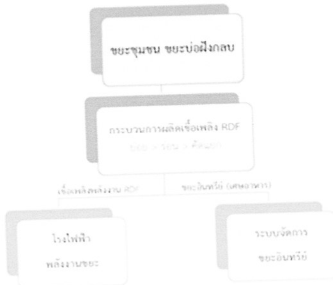
ภาพแสดงกระบวนการแปลงขยะเป็นเชื้อเพลิงพลังงาน